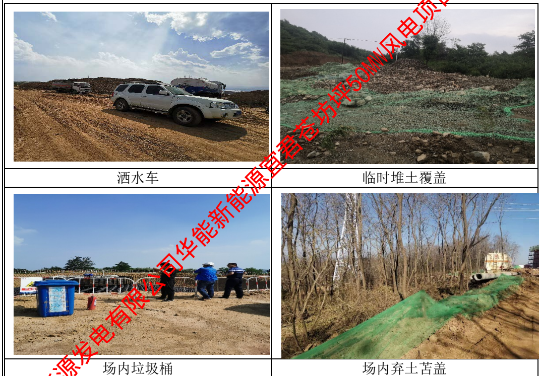
图 7-1 项目施工期环境保护措施