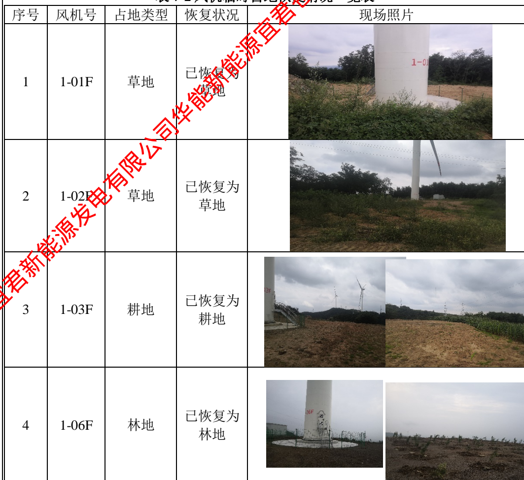
表 7-2 风机临时占地恢复情况一览表

项目风电机组占地面积 4.27hm 2 ，其中永久占地面积 0.68hm 2 、临时占地面积 3.59hm 2 ，占地类型主要为草地、林地和耕地。施工结束后，对临时占地进行了翻耕并恢复植被，恢复情况详见表 7-2。