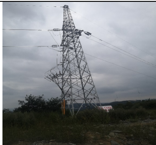
集电线路植被恢复