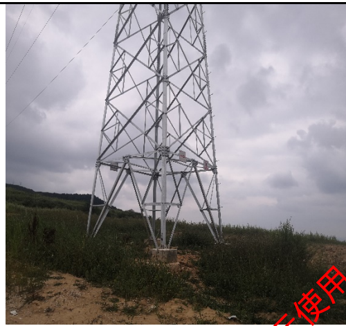
集电线路植被恢复